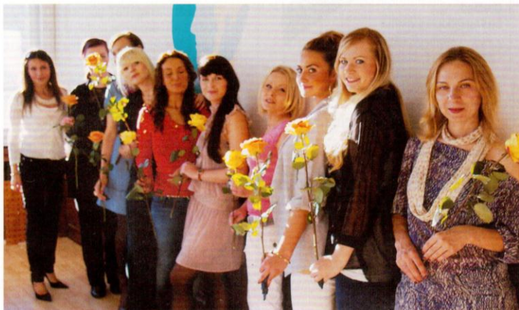
Die Absolventinnen der HBK freuen sich auf ihre berufliche Zukunft