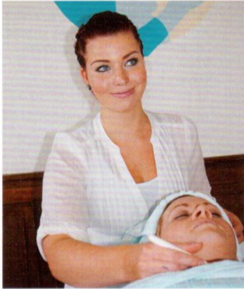
Übung macht die Meisterinnen